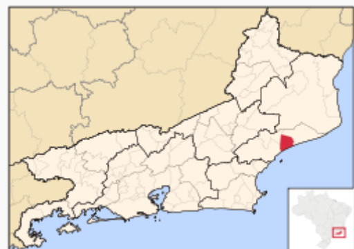
Localização de Carapebus no Rio de Janeiro