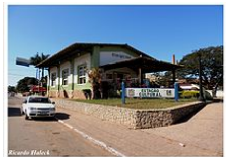
Cidade de Carapebus (RJ)