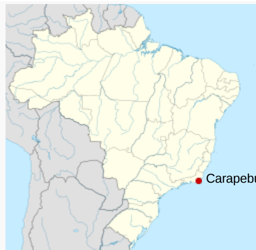
Localização de Carapebus no Brasil

A localidade Caxanga, surgida dentro da fazenda do mesmo nome, foi o primeiro núcleo de populacional carapebuense, com casas de negócios, armazéns, praça